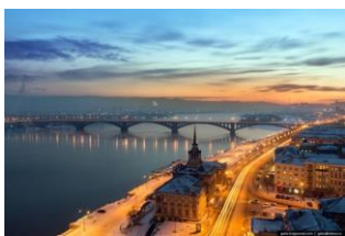
克拉斯诺亚尔斯克夜景