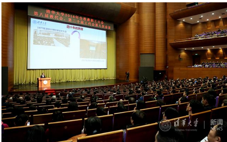
大会现场

3月22日下午，清华大学2018年全校教职工大会暨第八届教代会、第二十届工代会第八次会议在新清华学堂召开。校长邱勇，党委书记陈旭，党委常务副书记、副校长姜胜耀，党委副书记邓卫，副校长吉俊民、杨斌、王希勤，党委副书记过勇等出席大会，陈旭主持大会。大会在新清华学堂设主会场，并在音乐厅、主楼后厅和第六教室楼设分会场，全校2000多名教职工出席。