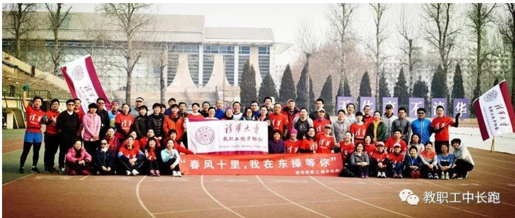
参加活动教职工合影

3月3日上午，校工会长跑协会的跑步活动在东大操场举行。活动共设10公里组和10里组，参加这次活动的教职工有来自学校三十个院系单位的101人，其中51人报名参加10km组，50人参加10里组。长跑协会的会员们快乐奔跑，留下的是快乐的身影！