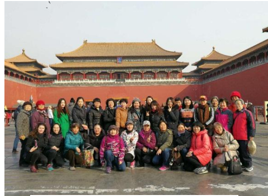
汽车系参加活动人员合影

3月9日，汽车系分工会组织了以“穿越古都中轴线，领略时代新风采”为主题的三八妇女节健步走活动。女教职工们从前门出发，穿越天安门广场，自南向北游览故宫博物院，至景山公园西门结束，总行程约8公里，共有三十余名女教职工参加本次活动。