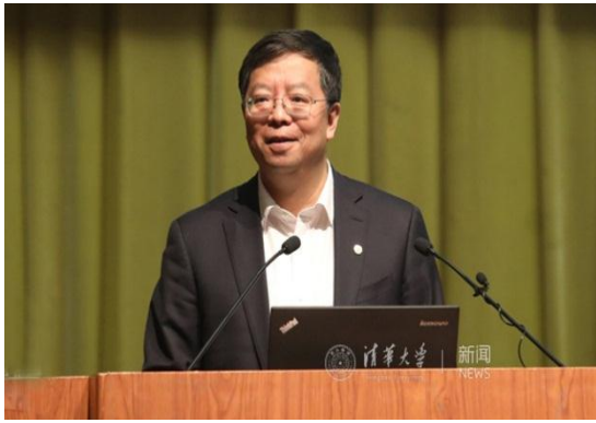
邱勇作学校工作报告

邱勇指出，未来的工作更要强调做细做深做实，不忘育人初心，实现高质量内涵式发展。学校确定了2018年的59项重点工作任务，邱勇就做好事业发展规划和校园承载力的研究论证，推进制定校园总体规划，推进医学学科建设，完善人才队伍建设方案，推进教学质量评价体系建设，完善学术评价标准，加快科技成果转化体制机制、产学研合作机制改革，协调推进行政机构改革与职工队伍人事制度改革协调推进，加快实施平安校园提升工程，加强安全意识与安全文化建设，完善国际学生培养与趋同管理体系等方面的工作做了具体阐述。