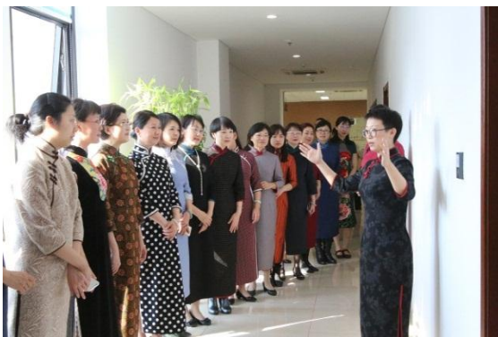
旗袍风采现场展示

3月8日下午，旗袍走“近”清华—《跟小格格学旗袍》分享会在图书馆北馆举行，活动由图书馆分工会和校工会水木舞团共同举办。老师们在现场进行旗袍风采展示，让大家看到不一样的旗袍，既有含蓄、隐约、矜持之美，又有典雅、雍容