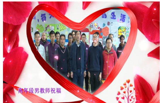
清华附小男教师们录制的祝福视频

3月8日，清华附小分工会精心准备了“八个一”惊喜祝福活动，一份甜甜蜜蜜的祝福，一次学生的快闪舞蹈，一场乐队献歌表演，一段“成志”祝福视频，一条温暖的丝巾，一次健步走活动，一场精彩的演出，一份女工保险及