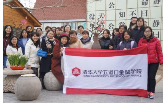
金融学院参加活动人员合影

3月7日，金融学院分工会组织了以“领略历史文化”为主题的三八妇女节活动。活动内容为参观观复博物馆，共有三十余名女教职工参加。一件件藏品在讲解员的讲解下变得鲜活起来，大家仿佛畅游在历史的长河中，一同领略了历史的变迁与厚重的文化底蕴。