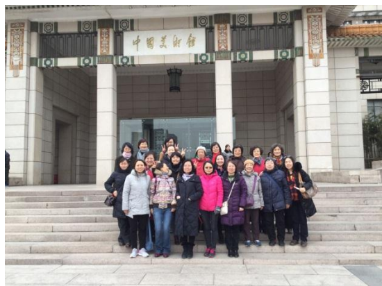
自动化系参加活动人员合影

三八妇女节到来之际，自动化系分工会组织大家到中国美术馆参观。通过这次活动，老师们了解了大师们何以将平凡的生活化为艺术的形式，在笔触、色彩、线条、墨韵中感性显现，从而在图像中领悟艺术的真谛。