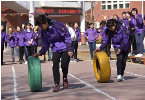
幼儿园趣味运动会滚轮胎

3月8日中午，阳光明媚、春意融融，幼儿园女教职工欢聚前院，开展了以“重团队合作、展女性风采”为主题的趣味运动会，包括热身操、滚轮胎、托球走、跳绳接力、两人三足、接力跑、移圈前进等项目，庆祝国际劳动妇女节。