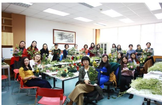
经管学院参加活动人员合影

3月8日下午，经管学院分工会在伟伦楼101举办用鲜花“点缀生活、点亮心境”为主题的插花活动，庆祝“三八”妇女节，学院20余位女教工参加活动。插花活动也是一次难得的师生互动、学习、融合的活动。