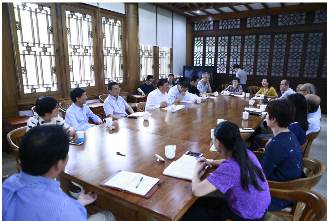
座谈会现场

把育人看得最重。不管是学校还是教师个人，都要把更多精力投入到教学中去，这是一项需要长期投入、奉献并具有长远意义和贡献的工作。邱勇表示，学校正在研究推进标杆课程建设，希望通过标杆课程来带动整体课程质量的提升。要推广航院等院系在教育教学工作上的好经验，对于院系的教育教学工作要纳入到年终考评，鼓励各个院系和教师努力做推进教育教学工作的标杆。