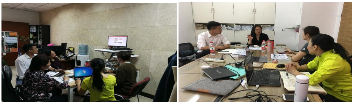
思政和文科组备赛讨论培训