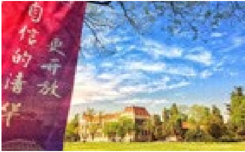
▲ 6月5日，教育研究院分工会举办“建国70周年”暨“建院40周年”摄影比赛