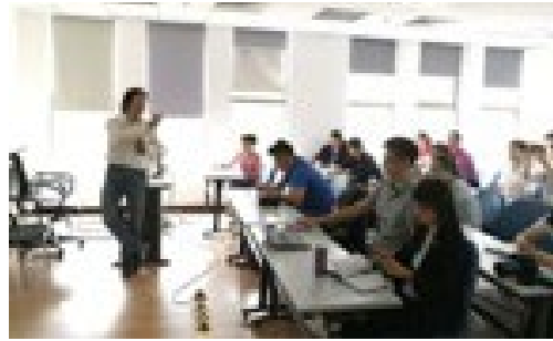
▲ 5月17日，继教学院组织开展教职工摄影培训