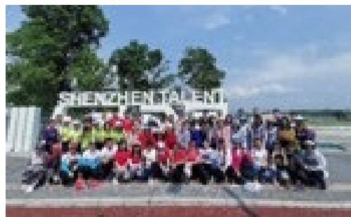
▲ 4月25日，由深研院工会组织的教职工“深圳人才公园徒步赛”在深圳湾边拉开帷幕。