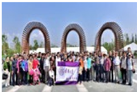
▲ 5月25日，生命学院组织教职工参观2019北京世界园艺博览会