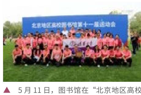
▲ 5月11日，图书馆在“北京地区高校图书馆第十一届运动会”上获得团体总分第三名