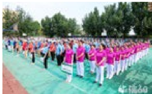
▲ 6月1日，第一附属医院举办60周年院庆职工趣味运动会