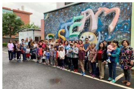
▲ 6月1日，自动化系组织赴中国教育电视台参观体验活动