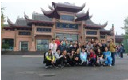
▲ 4月17日，二附院工会组织部分职工赴成都开展放松身心之旅。