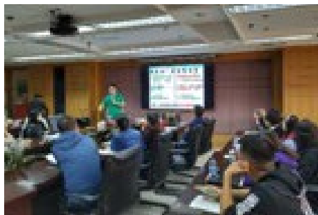
▲ 4月28日，出版社分会组织急救知识培训