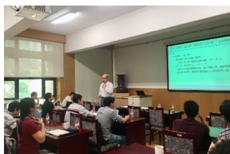
▲ 5月16日，化工系“2019年青年教师教学沙龙”举办