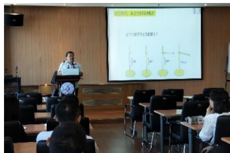
▲ 5月27日，航院分工会举办“未来教育趋势”讲座