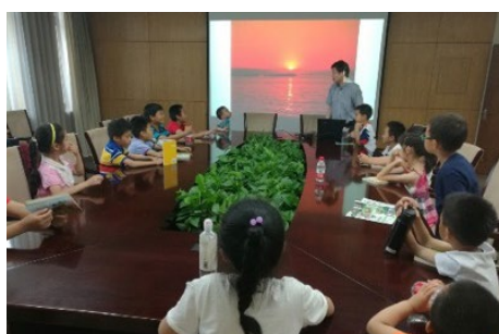
▲ 6月2日，工物系分工会组织“六一”儿童节探究实验室开放日活动