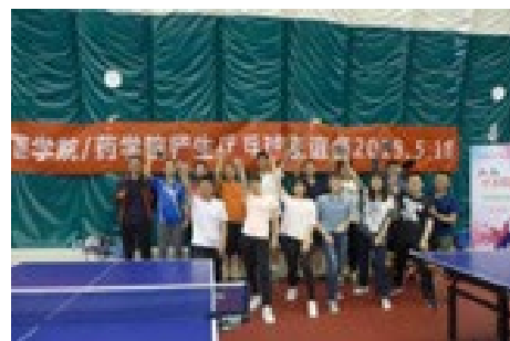
▲ 5月18日，首届医学院-药学院师生乒乓球友谊赛成功举办