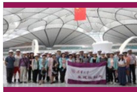
▲ 5月24日，基建处分会组织赴大兴国际机场参观学习