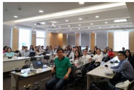
▲ 5月28日，五道口金融学院分会组织的首场“双双讲座”在双清大厦成功举办。