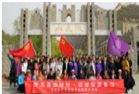
▲ 4月21日，清华附中分会组织2019年青年教师“五四”主题活动