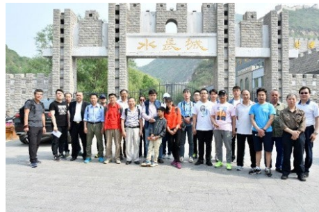
▲ 5月11日，基础工业训练中心分工会组织教职工春游