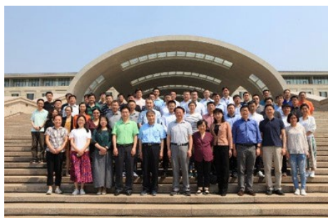
▲ 5月24-25日，电子系召开第二十三届“青年教师学术论坛”