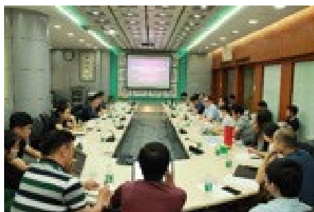
▲ 6月29日，公管学院召开青年教师教学基本功比赛总结暨教学经验交流会