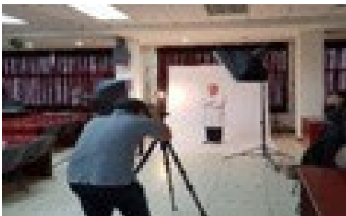
▲ 5月12日，校医院分工会组织为职工拍摄“最美工作照”