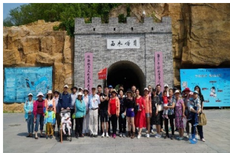
▲ 5月25日，车辆学院分工会组织教职工春游