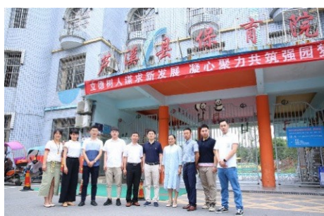
▲ 6月25日，信研院联合清承教育赴江西省芦溪县开展公益支教活动