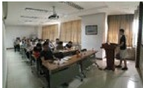
▲ 5月28日，学生社区管理服务中心举办发扬“五四精神”理论培训