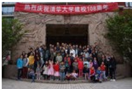
▲ 4月27日，金融学院办分工举会校庆亲子校园体验活动