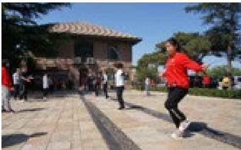
▲ 4月26日，正大公司组织第三届趣味运动会