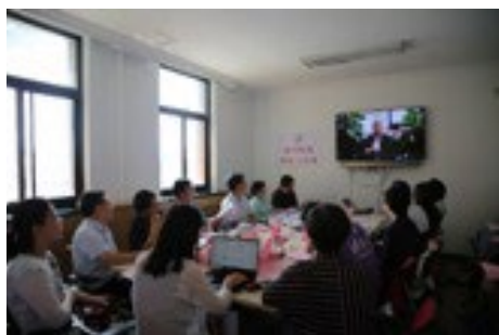
▲ 6月18日，社科学院分会“教职工之家”顺利验收