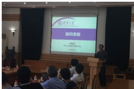
▲ 5月22日，精仪系2019年春季教师沙龙举办