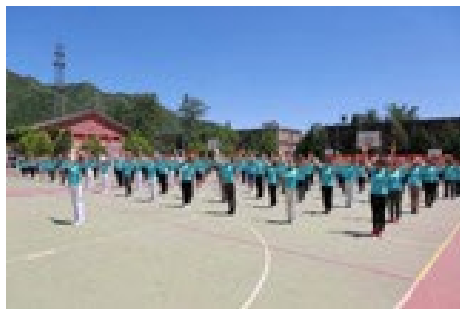
▲ 5月27日，核研院举办2019年教职工运动会