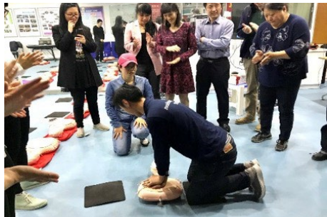
▲ 4月25日，机械系分工会举办心肺复苏急救知识讲座