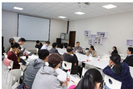
▲ 4月18日，计算机系分工会举办青年教师教学沙龙