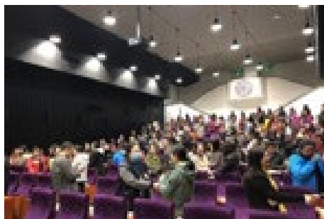
▲ 4月11日，财务处分会举办“全面压力管理”培训