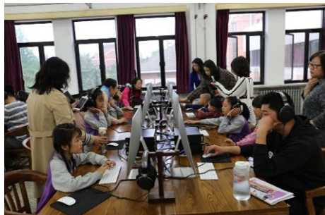
▲ 4月28日，土水学院与图书馆分工会联合举办“让孩子们爱上图书馆”特色活动