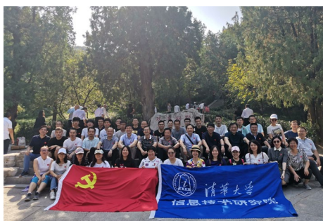
▲ 9月26日，信研院分工会、党支部组织教职工50余人到香山公园进行红色教育健步行