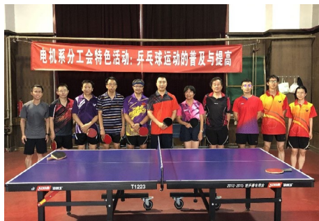
▲ 9月22日下午，电机系分工会在教工活动中心举办了“乒乓球运动的普及与提高”特色活动