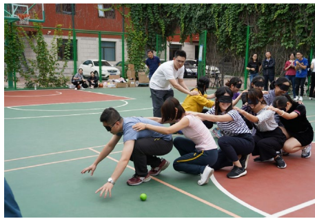
▲ 9月12日上午，2019清华大学五道口金融学院教职工秋季趣味运动会在学院篮球场举行