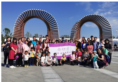
▲ 9月21日，医学院-药学院分工会组织参观2019北京世界园艺博览会活动