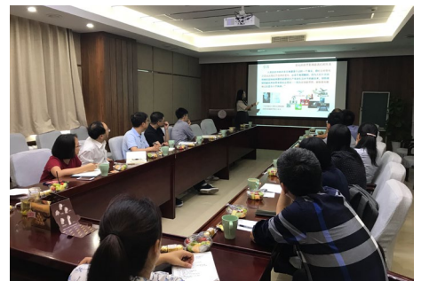
▲ 9月25日，化学系2019年秋季学期第一次青年教师沙龙暨新教师教学培训活动