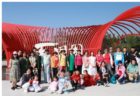
▲ 9月20日和21日，图书馆分工会分两批组织前往“2019北京世界园艺博览会”秋游，共有近百名人参加了本次活动