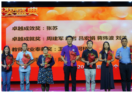
▲ 9月10日，清华附中举行了主题为“庆祝新中国七十华诞，弘扬新时代尊师风尚”的第三十五个教师节庆祝大会