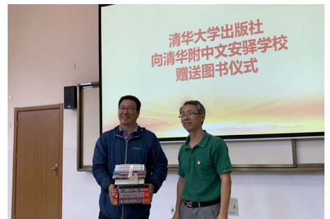
▲ 9月21日下午，清华大学出版社35位同志，到陕北延川县清华附中文安驿学校，捐书助学