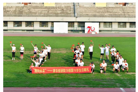
▲ 9月28日下午，核研院举办建国70周年献礼跑步特色活动