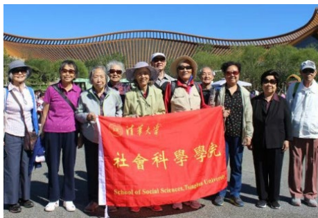
▲ 9月18日和9月21日，社科学院分工会分别组织了两次前往北京世界园艺博览会秋游活动。