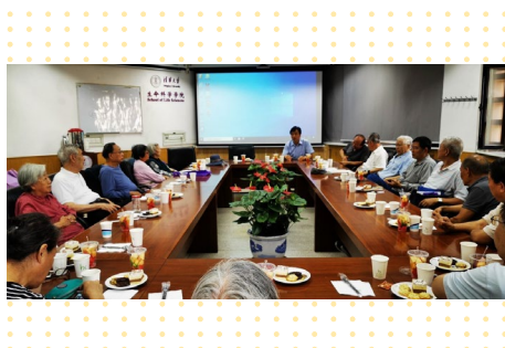
▲ 9月27日，生命学院一年一度的“退休教职工迎重阳祝寿座谈会”在生命科学馆举行。