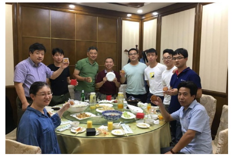
▲ 9月12日中秋佳节，训练中心工会组织不能回家过节的职工们一起吃了一次别样的团圆饭