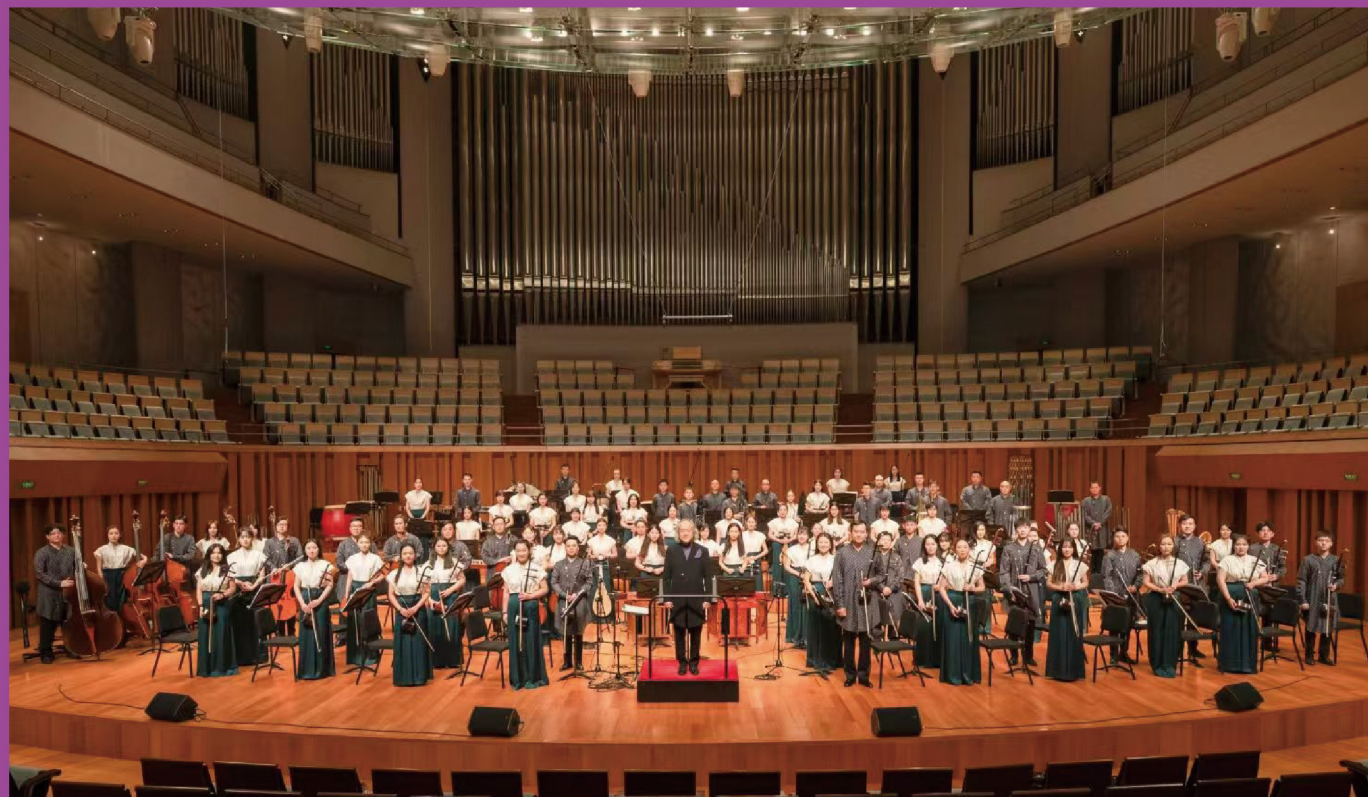
中国音乐学院民族乐团