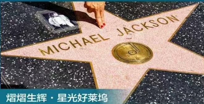
熠熠生辉 · 星光好莱坞