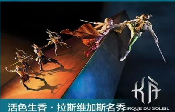
活色生香 · 拉斯维加斯名秀 CIRQUE DU SOLEIL