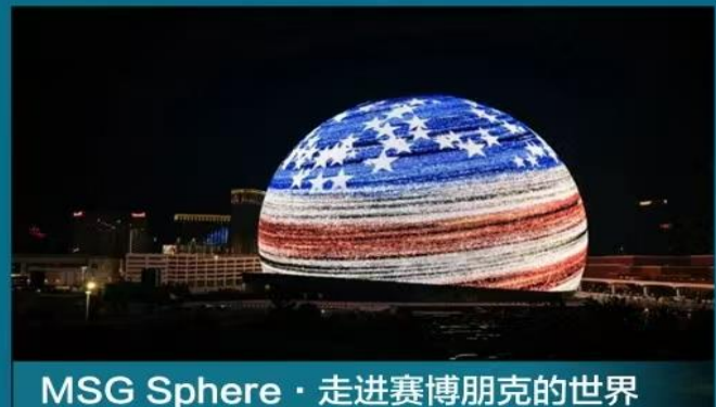
MSG Sphere · 走进赛博朋克的世界