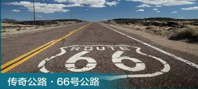
传奇公路 · 66号公路