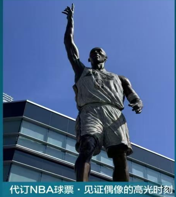
代订NBA球票 · 见证偶像的高光时刻