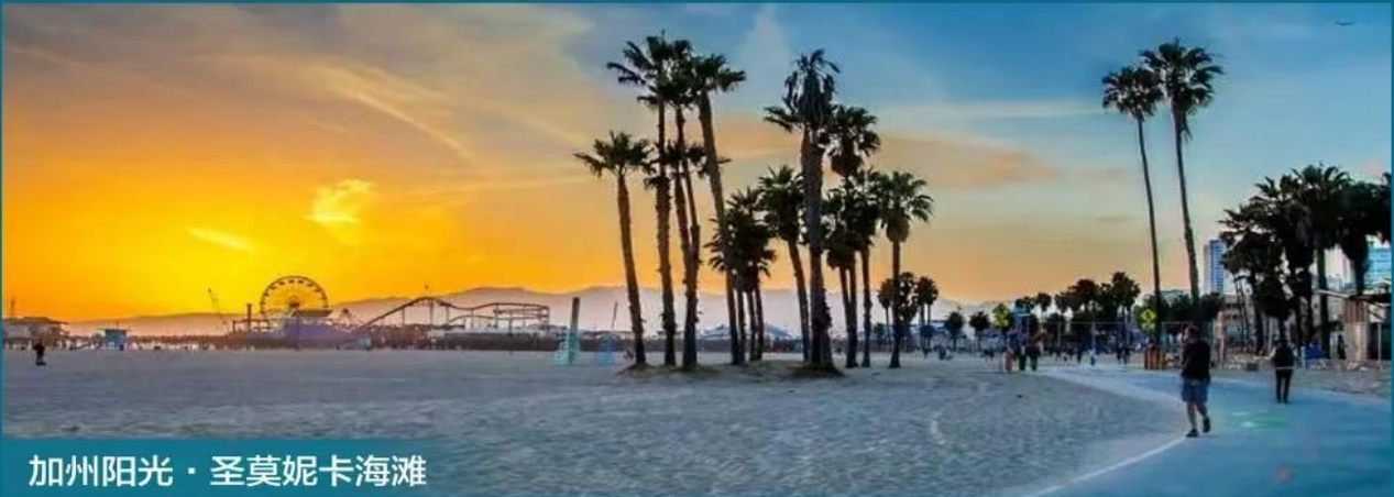
加州阳光 · 圣莫妮卡海滩