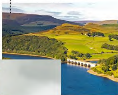
英国峰区国家公园