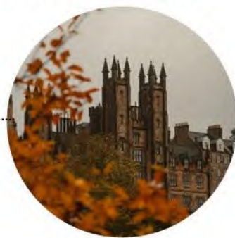
爱丁堡城堡(含门票)