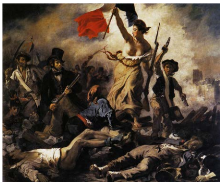
德拉克罗瓦《自由引导人民》