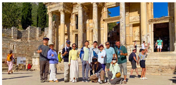
2025年暑假土耳其游学·以弗所古城