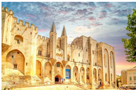
法国阿维尼翁教堂