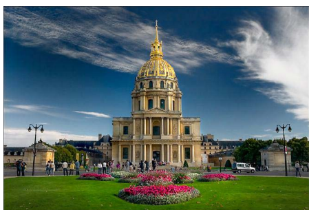
巴黎荣军院 Les Invalides