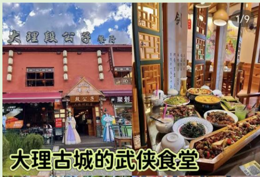
大理古城的武侠食堂